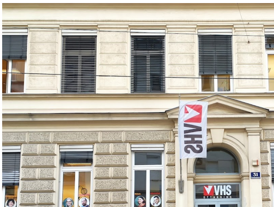
Pildil Ottakringi Rahvaülikool Viinis

Olulisel kohal on nõustamine, nt lisaks õppenõustamisele on rahvaülikoolides on ka sotsiaalnõustaja, kes aitab isikupõhiselt lahendada erinevaid probleeme, mis võivad takistada õppetööl keskendumist ja kes teeb seejuures võrgustikutööd kohalike omavalitsuste ja erinevate abiorganisatsioonidega. Nii saavad õpetajad keskenduda õpetamisele, ega pea tegelema õppijate tagaotsimisega jms. Lõpetamise määr on tänu sellele 80%! Ja kes kohe ei lõpeta, leiavad sageli ringiga tee tagasi rahvaülikooli!