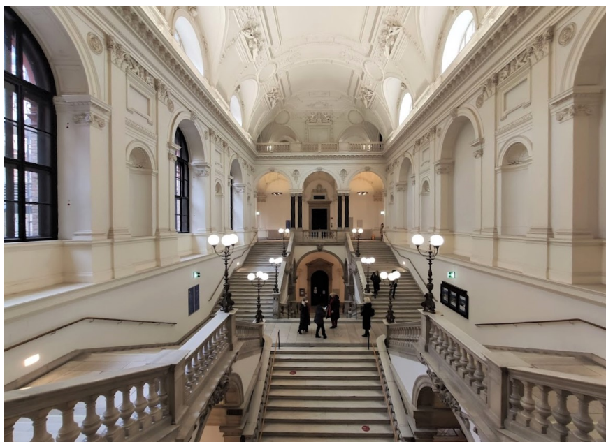
Pildil: Viini Ülikooli peahoone imposantne sisemus; ülikool on ka Austria suurim täienduskoolituste pakkuja