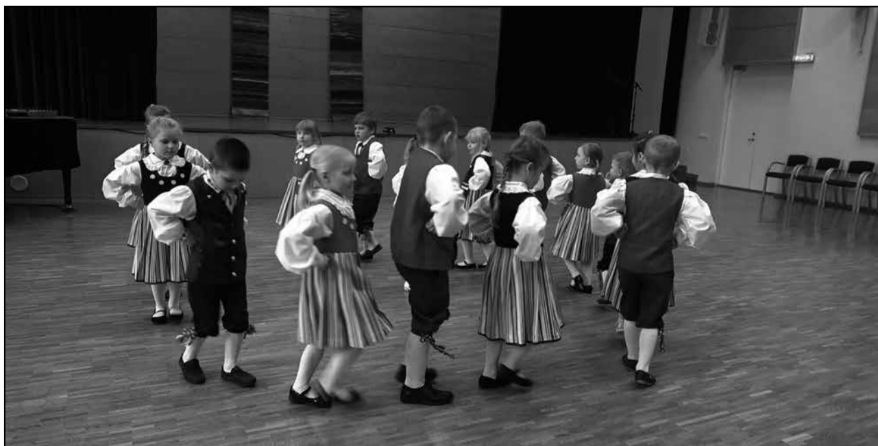
Vahvad tantsulapsed esinesid tublidele tunnustatutele seekõrd videos.