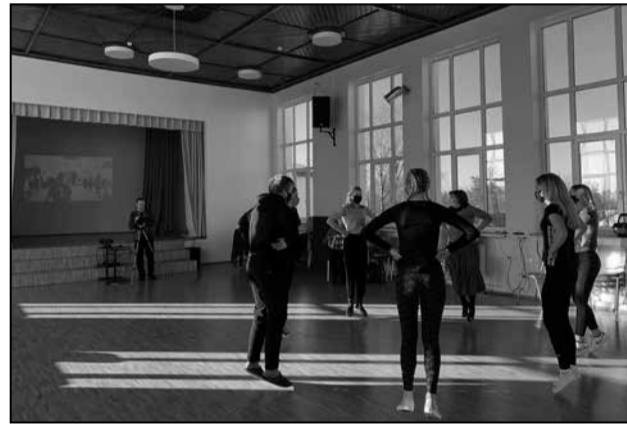
Eesti ja Vene rahvatantsude õppimine videosilla vahendusel.

Seminaril võeti kokku projekti tulemusi, tehti ülevaade valminud õppematerjalidest ja meetodikatest, mis käsitlevad Peipsi-Pihkva järve ühist kultuuri- ja looduspärandit; lähemalt tutvustati näiteks valminud veebiviktoriini (vt www.ctc.ee/viktoriinid ) ja Peipsi järve lõimitud õppe materjale, mis on eesti keeles leitavad Röpina Ühisgümnaasiumi kodulehel: yg.rapina.ee/avaleht/eesti-vene-koostooprojekt/ .