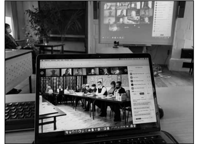
Projekti CuNaHe lõpuseminar veebikeskkonnas.