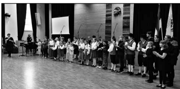
Koolipere tähistas Eesti Vabariigi aastapäeva koolisiseses aktusega, kus õpilased esinesid pidupäevaks ettevalmistatud etteastetega.

Samal nädalal, mil pidasime vastlapäeva, 18. veebruaril toimus koolis COVID-19 vastane vaktsineerimine. Suurem osa kooli personalist lasi end kaitsepookida ning kellelgi tõsisemaid kõrvaltoimeid ei avaldanud. Oli küll inimesi, kel tekkisid esimesel ööl väike palavik või külmavapped, kuid järgmiseks päevaks oli vaktsineerimisest tingitud halb enesetunne kadunud. Jääme