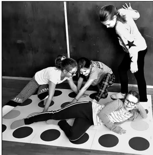
Nüüd kulgevad vahetunnid veelgi aktiivsemalt ja lõbusalt.