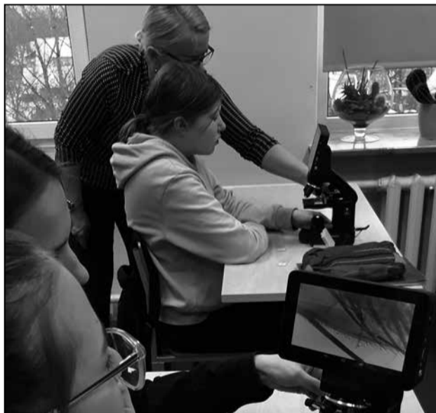
Kõrgtehnoloogilised seadmed muudavad õppimise veelgi põnevamaks.