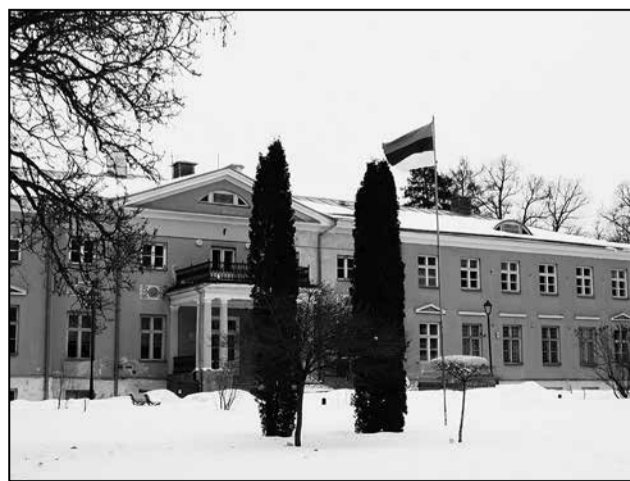
Röpina mõisa peahoone