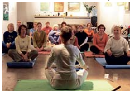
Kundalini jooga Jõgevamaal.

Milles siis avaldub selle valla koolitussõbralikkus? Mõned näited: valla allasutuste ruumid on MTÜ-dele ja tegusatele inimestele tasuta kasutamiseks. Vald on kaasrahasutanud mitmeid kodanikualgatusi, MTÜ-d ja raamatukogud on võrdväärset partnerid. Iga piirkond saab juba mitu aastat suvise ekskursiooni korraldamiseks 5000 krooni toetust, et pakkuda täiskasvanud elanikele võimalust silmaringi avar-