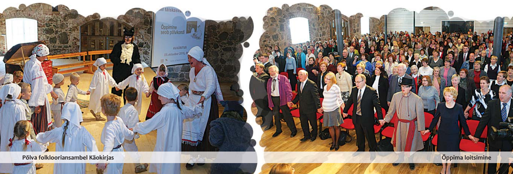
Põlva folklooriansambel Käokirjas