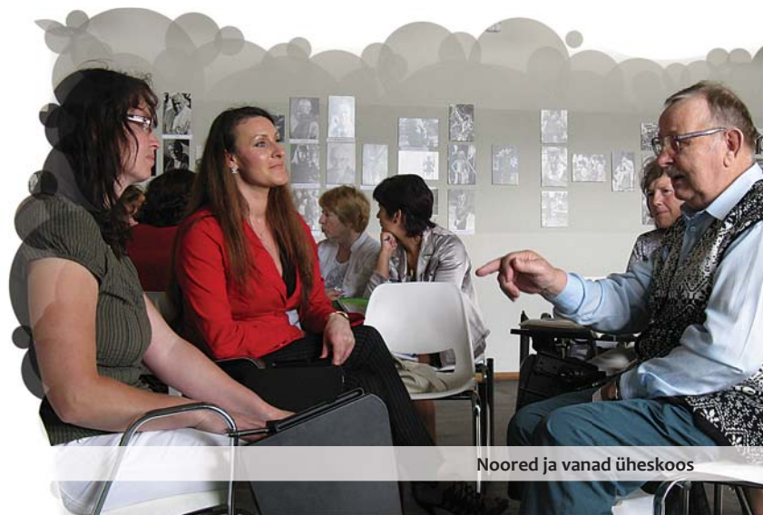
Noored ja vanad üheskoos