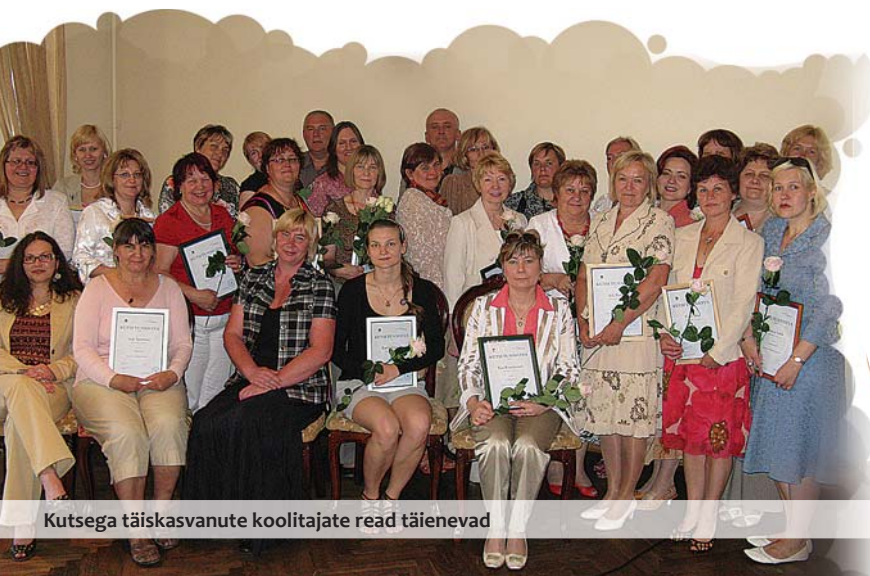
Kutsega täiskasvanute koolitajate read täienevad