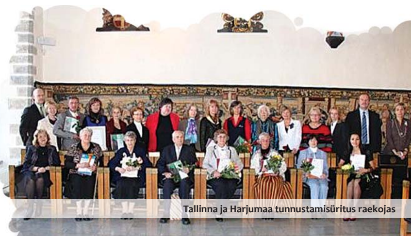
Tallinna ja Harjumaa tunnustamisüritus raekojas