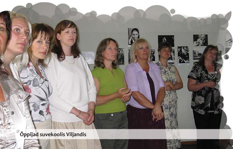
Õppijad suvekoolis Viljandis