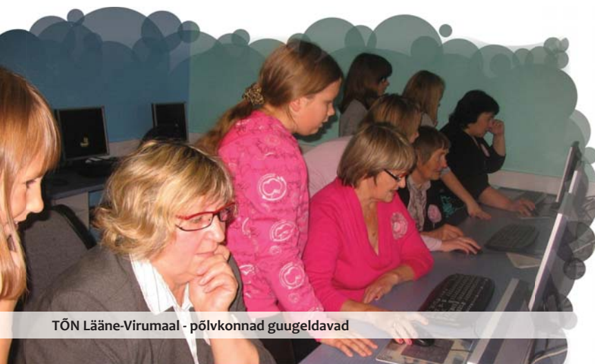
TÕN Lääne-Virumaal - põlvkonnad guugeldavad

Me hoiame nõnda ühte / kui heitunud mesilaspere / me hoiame nõnda ühte / ja läheme läbi mere on öelnud luuletaja Paul-Eerik Rummo. On hea teada, et on neid, kellega koos edasi minna. Kui tarvis, ka läbi mere.