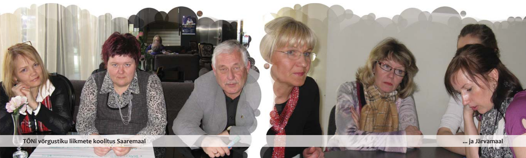
TÕNi võrgustiku liikmete koolitus Saaremaal