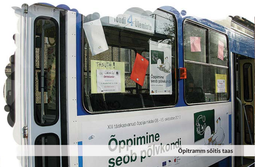
Õpitramm sõitis taas