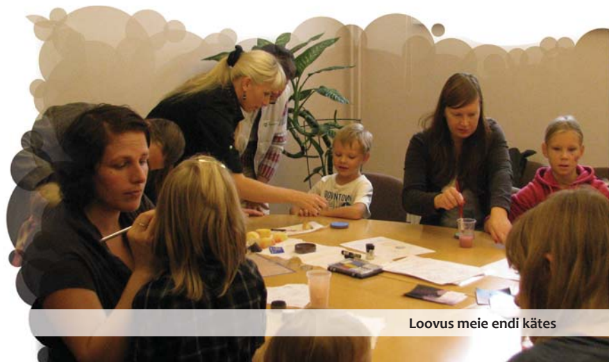
Loovus meie endi kätes