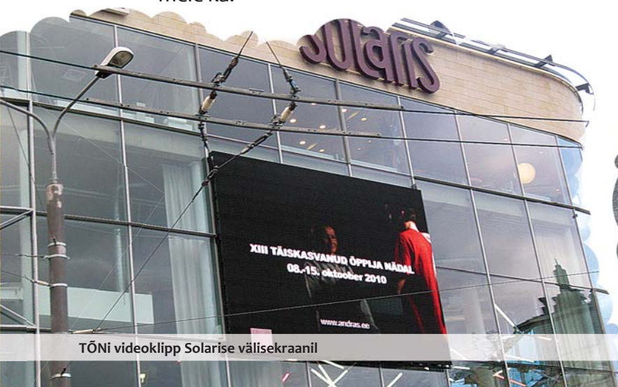
TÕNi videoklipp Solarise välisekraanil

Sel aastal jõudis täiskasvanud õppija nädala reklaamklipp ka kaubanduskeskuste sise- ja väliekraanidele, kinodesse üle Eesti ning parvlaevadelegi. Vaatajate sooja vastuvõtu saanud humoorikat videolugu breikivast prouast, kellel pole kunagi hilja õppida, said näha kümned tuhanded kino- ja kaubanduskeskuste külastajad. Andrase koduleheküljel www.andras.ee on võimalik lühikeste videolugude vahendusel tutvust teha tunnustatud õppijatega, aga ka teiste sellel aastal tiitlisaanutega, et ammutada julgust ja jõudu. Kui nemad said, saame meie ka!