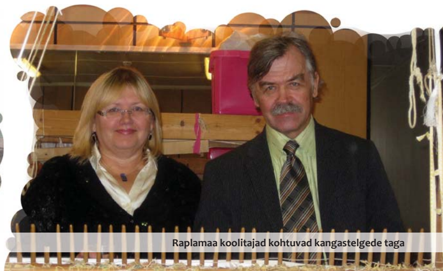
Raplamaa koolitajad kohtuvad kangastelgedega taga