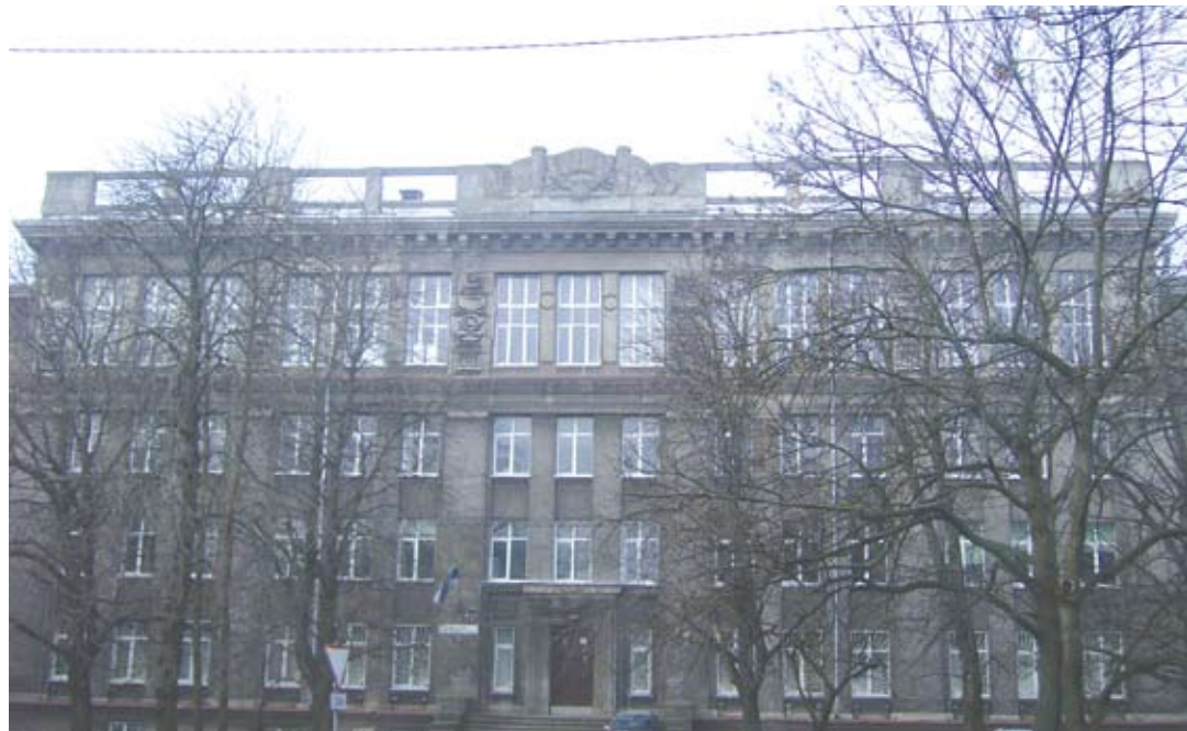
Фото: Из архива гимназии (2)

Наплыв учащихся наблюдается в этом учебном году и в Таллиннской Каламаяской гимназии для взрослых: по состоянию на 10 сентября, когда закрывается Ученический регистр, здесь было 702 учащихся. Теперь их уже больше, и желающие учиться продолжают записываться. Причем больше половины учащихся составляют люди, которым уже перевалило за 20. В основном возраст – от 18 до 22 лет, а самому старшему ученику – 47 лет.