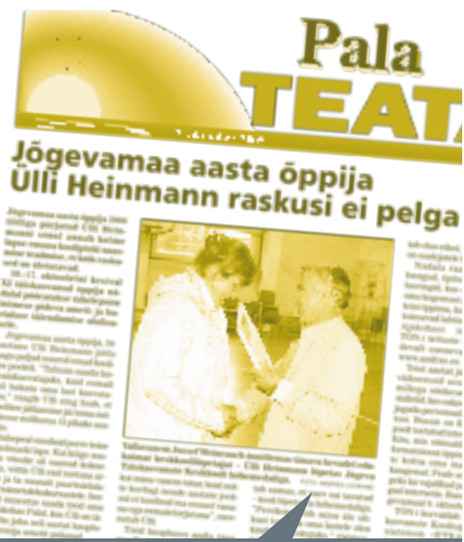
Pala Teataja, oktoober 2008

Elukestva õppe tema ja selle kajastamise olulisuse osas olid seminaril osalenud vallalehtede toimetajad ühel meelel. Lisaks kursuste ja koolituste kohta teabe jagamisele leiti, et lehest oleks innustav lugeda ka inimeste õpilugusid sellest, kuidas on selgeks õpitud sootuks teine amet või kuidas tänu hobile on mõni oskus põhjalikumalt omandatud.