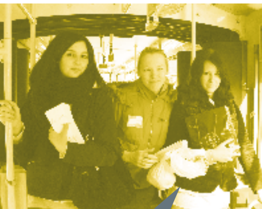
Tallinna Täiskasvanute Gümnaasiumi neid