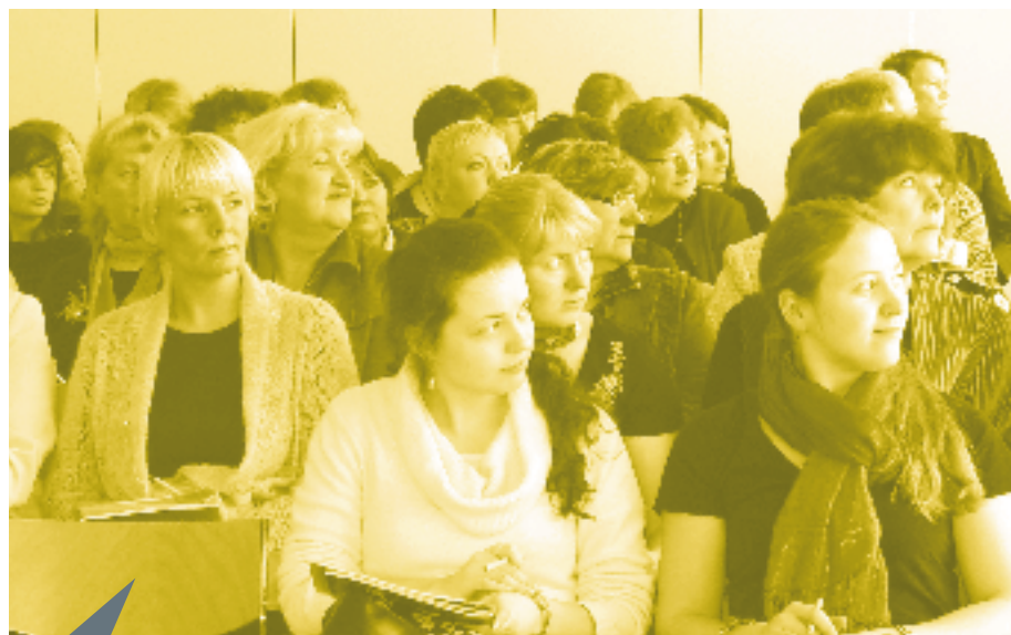
Üle-eestiline TÕNi võrgustik on iga aastaga laienenud.