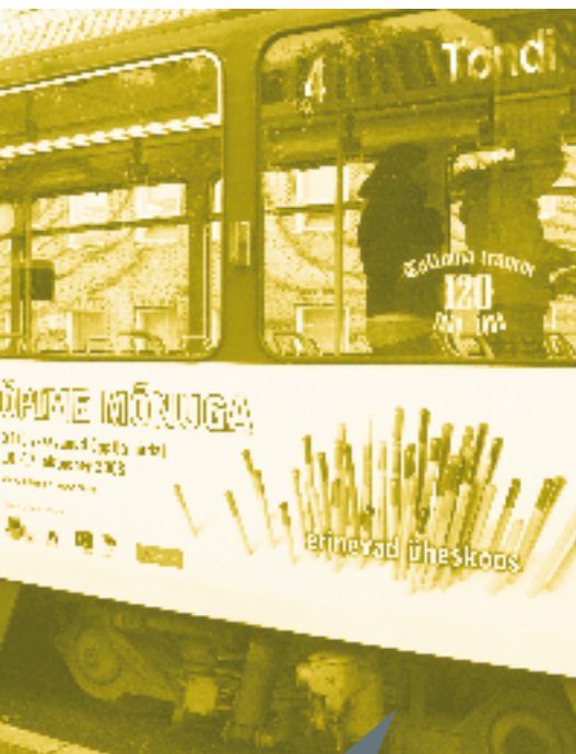
Tramm nr 4 viib Tondilt Ülemistele.

Õpitrammi projekti viis ellu MTÜ Verte! koostöös ETKAga Andras.