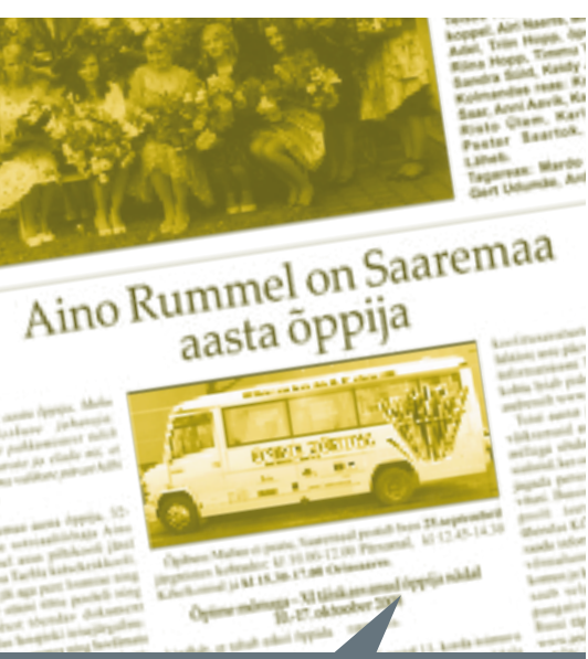
Muhulane, september 2008