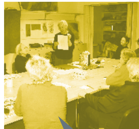
TÕNi ajal jätkus tegevusi kõikidesse maakondadesse ning linnadesse ja küladesse.