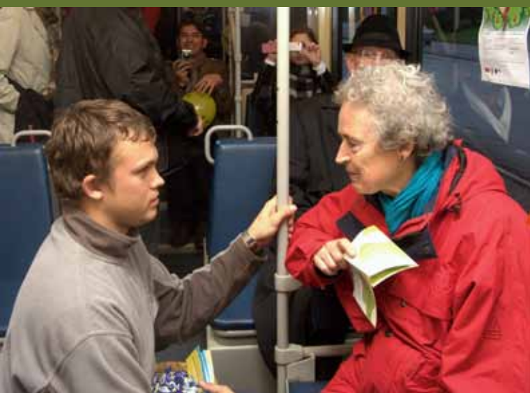
Õpitemmis jagasid oma lugemiselamusi nii tuntud kultuuritegelased kui ka tavareisijad.