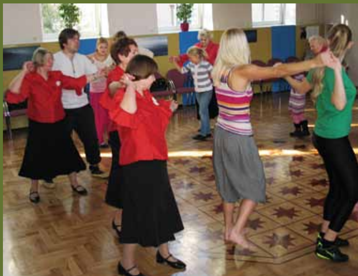
Tallinna Pelgulinna rahvamajas kogunesid tantsuhuvilised.