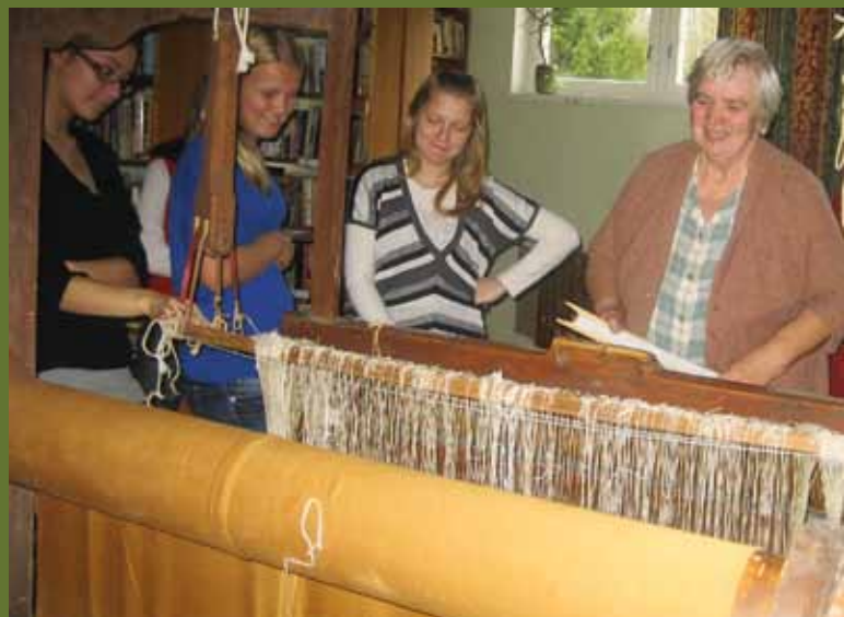
Martnas anti nooremale põlvele edasi kangastelgedel kudumise tarkust.