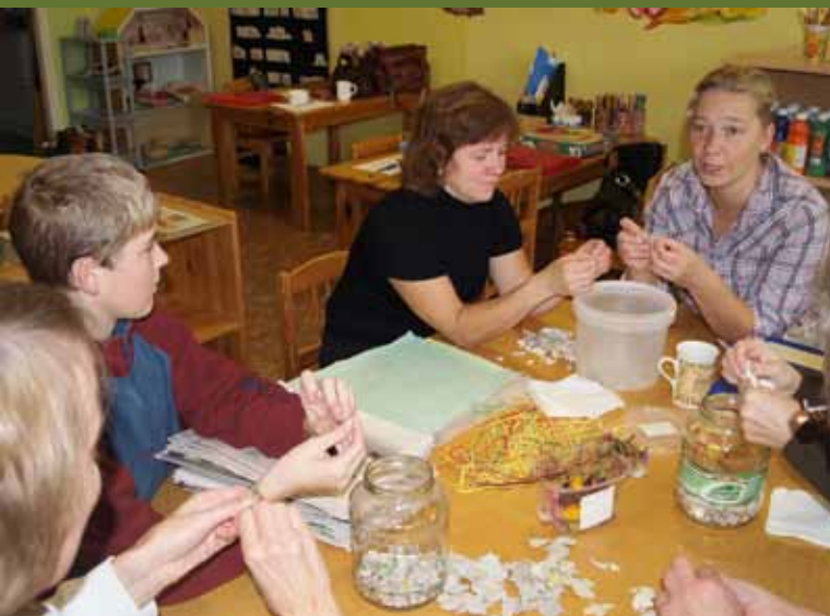
Põlvamaal sai selgeks, kuidas ise paberit teha.