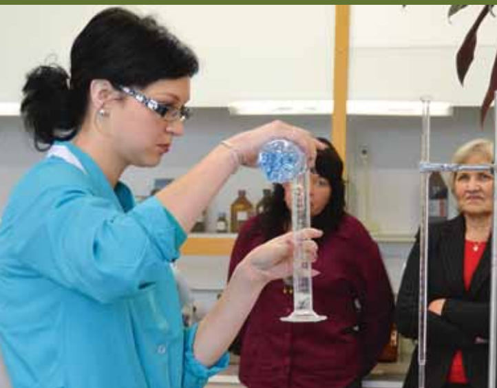
TTÜ Virumaa kolledžis õpetati kiirtestiga määrama jookide pH-d.