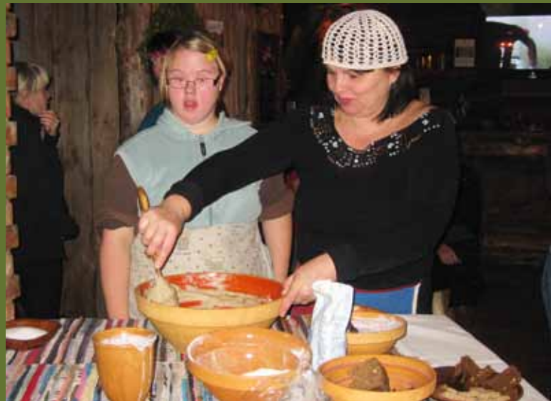
Võrumaal Hämsas proovis rahvas leivategu.