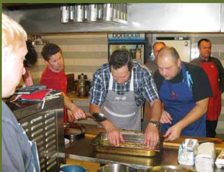
Saaremaa mehed lähenesid kalale teise nurga alt.