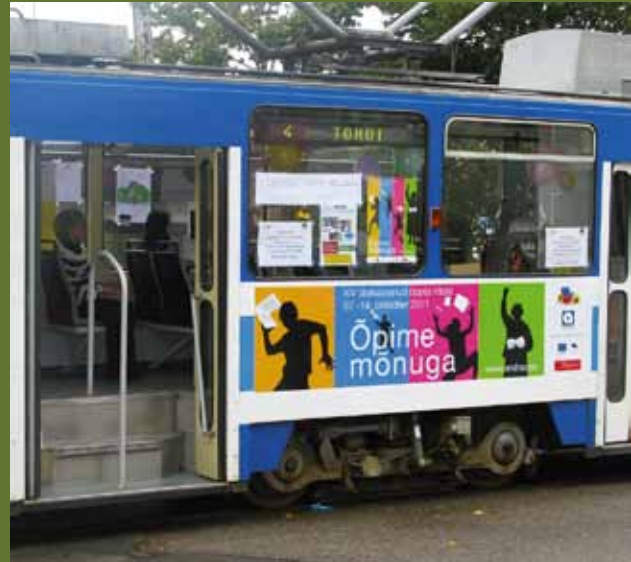
Tallinnas sõitis ringi õpitramm.