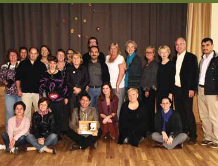
Külalised Iirimaa, Prantsusmaa, Türgist, Ungarist, Hollandist ja Sloveeniast TÖN-i avaüritusel Raplas