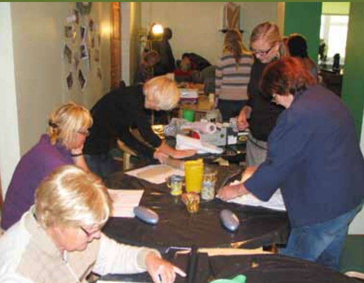
Lülemäe rahvaõpistu keraamika õpitoas said valgamaalased näpud saviseks.