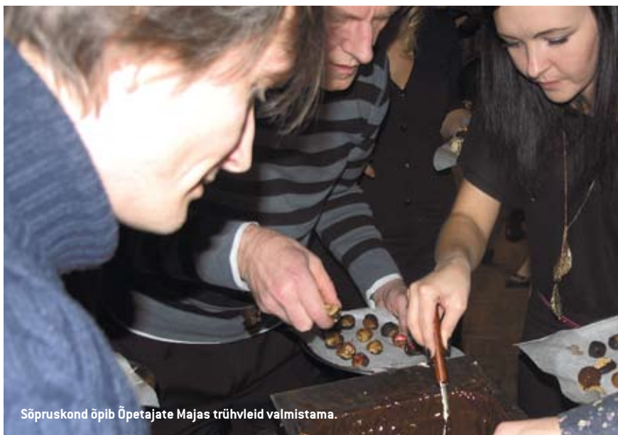
Sõpruskond õpib Õpetajate Majas trühvleid valmistama.