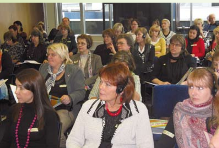
Täiskasvanute gümnaasiumide ja kutsekoolide õpetajad tutvusid Suurbritannia kogemustega. Sügis 2010